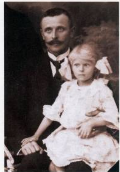
Błogosławiona SANCJA Szymkowiak 1910 - 1942